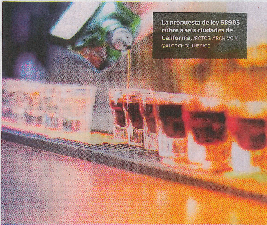
La propuesta de ley SB905 cubre a seis ciudades de California.